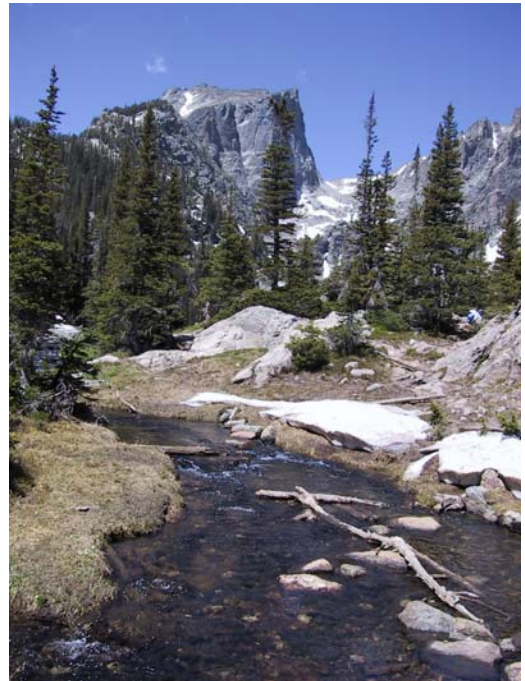
Rocky Mountains National Park